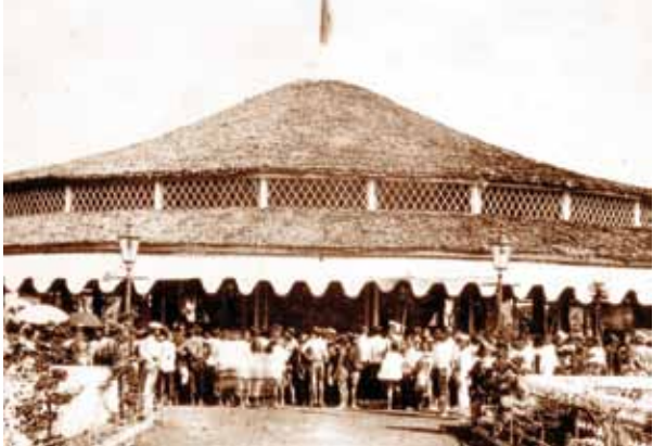
ภาพชุมชนที่ไม่ได้สร้างขึ้น ณ ห้องสนามหลวง เพื่อใช้จัดแสดงนิทรรศการแห่งชาติเอกอิมพีชัน ในการสมโภชพระนครครบรอบร้อยปีแรก พ.ศ.2425

เพราะเป็นครั้งแรกในประวัติศาสตร์ที่ภาคเอกชน และประชาชนต่างมีส่วนร่วมฉลองในครั้งนี้ โดยร่วมผลิตสินค้า ข้าวของ เครื่องใช้ ของที่ระลึก ที่พิมพ์ตราสัญลักษณ์สมโภชกรุงฯ ลงไป ถ้านับจำนวนรายการสิ่งของที่ประชาชนร่วมสมโภชกรุงเทพฯ ครบ 200 ปี ก็น่าจะมี