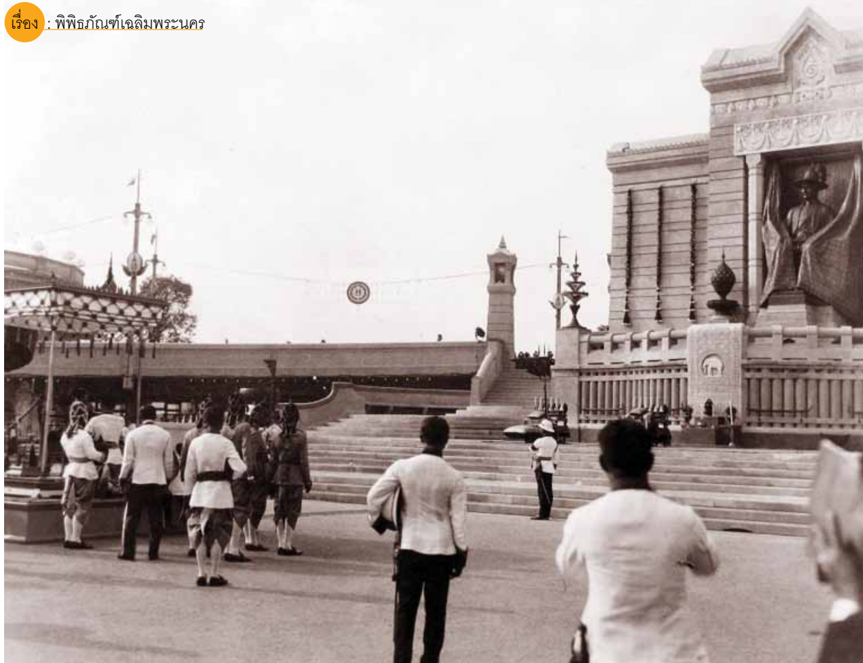
ภาพถ่ายพระบาทสมเด็จพระปกเกล้าเจ้าอยู่หัว รัชกาลที่ 7 ทรงเปิดพระวิสูตรอนุสาวรีย์พระปฐมบรมราชานุสรณ์ในพระบาทสมเด็จพระพุทธยอดฟ้าจุฬาโลกย์ที่บริเวณเชิงสะพานพระพุทธรูปอดฟ้า ในงานเฉลิมพระนครครบรอบ 150 ปี เมื่อวันที่ 6 เมษายน พ.ศ. 2475

จวบจนปีนี้พุทธศักราช 2556 กรุงเทพมหานครมีอายุครบรอบ 231 ปีบริบูรณ์มหานครแห่งนี้ยังคงเจริญต่อไปอย่างไม่เหน็ดเหนื่อย ไม่มีแม้แต่จะหยุดพักหายใจ ดึกสูงเสียดฟ้าสุดให้เห็นกลิ่นเมือง วันที่ยิ่งใหญ่ถือเป็นเรื่องปกติของคนกรุงเทพมหานคร แต่ทว่าความจริงของกรุงเทพมหานครในวันนั้นก็กลับสวนทางกับความรักความใส่ใจของคนกรุงที่มีต่อมหานครที่ตนอาศัยอยู่ ตามลำดับในวันนี้มีได้เต็มไปด้วยฝูงปลาที่แหวกว่ายเหมือนดังลาคลองเมื่อครั้งงานเฉลิมพระนคร 100 ปี 150 ปี และ 200 ปี แต่ทว่ากลับเต็มไปด้วยขยะกระป๋อง ขวดพลาสติก ที่คนกรุงเทพฯ ขว้างลงไป เป็นสัญลักษณ์แห่งความมั่งคั่งของเมือง