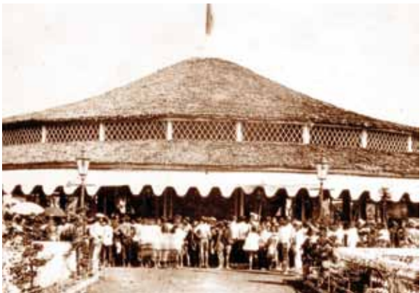
ภาพหมู่ไม้ที่ไม่ได้สร้างขึ้น ณ ห้องสนามหลวง เพื่อใช้จัดแสดงนิทรรศการแห่งชาติเอกอิมพีชัน ในการสมโภชพระนครครบรอบร้อยปีแรก พ.ศ.2425

เพราะเป็นครั้งแรกในประวัติศาสตร์ที่ภาคเอกชน และประชาชนต่างมีส่วนร่วมฉลองในครั้งนี้ โดยร่วมผลิตสินค้า ข้าวของ เครื่องใช้ ของที่ระลึก ที่พิมพ์ตราสัญลักษณ์สมโภชกรุงฯ ลงไป ถ้านับจำนวนรายการสิ่งของที่ประชาชนร่วมสมโภชกรุงเทพฯครบ 200 ปี ก็น่าจะมี