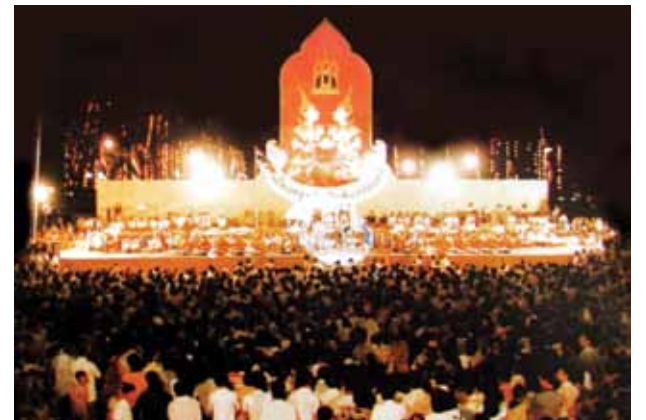
บรรยากาศมหกรรมการแสดงในงานสมโภชกรุงรัตนโกสินทร์ 200 ปี พ.ศ. 2525 ณ ห้องสนามหลวง

ไม่ต่ำกว่าหมื่นรายการ ซึ่งถ้าหากถึงอดีตในวันนั้นหรือ 31 ปีที่แล้ว ถือได้ว่าเป็นวันที่สังคมไทยสงบ สันติ และมีความสุขกับการฉลองมหานครแห่งนี้เป็นอย่างมาก ภาพของคนไทยที่หลังไหล่ท่วมท้นแออัดเต็มห้องสนามหลวง มีไม้เท้าเพื่อประหว่งไม้เท้าเพื่อ