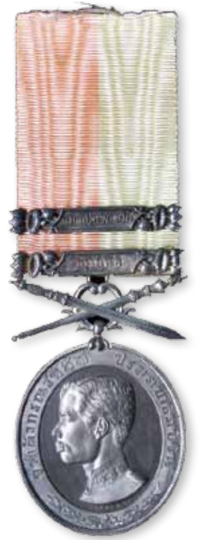
เหรียญดุษฎีมาลา ด้านหน้าเป็นพระบรมรูปพระบาทสมเด็จพระจุลจอมเกล้าเจ้าอยู่หัว เบื้องบนมีพระแสงขรรค์ชัยสิทธิ์กับธารพระกรไขว้กัน มีห่วงยึดกับแผ่นโลหะจารึกว่า “ทรงยินดี” เป็นเหรียญพระราชทานพร้อมกับการเข้ารับราชการในพระองค์

จวบจนปีนี้พุทธศักราช 2556 กรุงเทพมหานครมีอายุครบรอบ 231 ปีบริบูรณ์มหานครแห่งนี้ยังคงเจริญต่อไปอย่างไม่เหน็ดเหนื่อย ไม่มีแม้แต่จะหยุดพักหายใจ ดึกสูงเสียดฟ้าสุดให้เห็นกลิ่นเมือง วันที่ยิ่งใหญ่ถือเป็นเรื่องปกติของคนกรุงเทพมหานคร แต่ทว่าความจริงของกรุงเทพมหานครในวันนั้นก็กลับสวนทางกับความรักความใส่ใจของคนกรุงที่มีต่อมหานครที่ตนอาศัยอยู่ ตามลำดับในวันนี้มีได้เต็มไปด้วยฝูงปลาที่แหวกว่ายเหมือนดังลาคลองเมื่อครั้งงานเฉลิมพระนคร 100 ปี 150 ปี และ 200 ปี แต่ทว่ากลับเต็มไปด้วยขยะกระป๋อง ขวดพลาสติก ที่คนกรุงเทพฯ ขว้างลงไป เป็นสัญลักษณ์แห่งความมั่งคั่งของเมือง