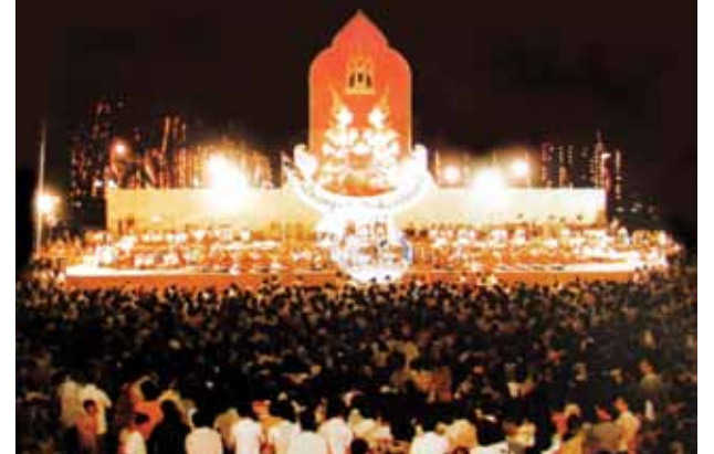
บรรยากาศมหกรรมการแสดงในงานสมโภชกรุงรัตนโกสินทร์ 200 ปี พ.ศ. 2525 ณ ห้องสนามหลวง

ไม่ต่ำกว่าหมื่นรายการ ซึ่งถ้าหากนับถึงอดีตในวันนั้นหรือ 31 ปีที่แล้ว ถือได้ว่าเป็นวันที่สังคมไทยสงบ สันติ และมีความสุขกับการฉลองมหานครแห่งนี้เป็นอย่างมาก ภาพของคนไทยที่หลังไหล่ท่วมท้นแออัดเต็มท้องสนามหลวง มีไม้เท้าเพื่อประหารวังไม้เท้าเพื่อ