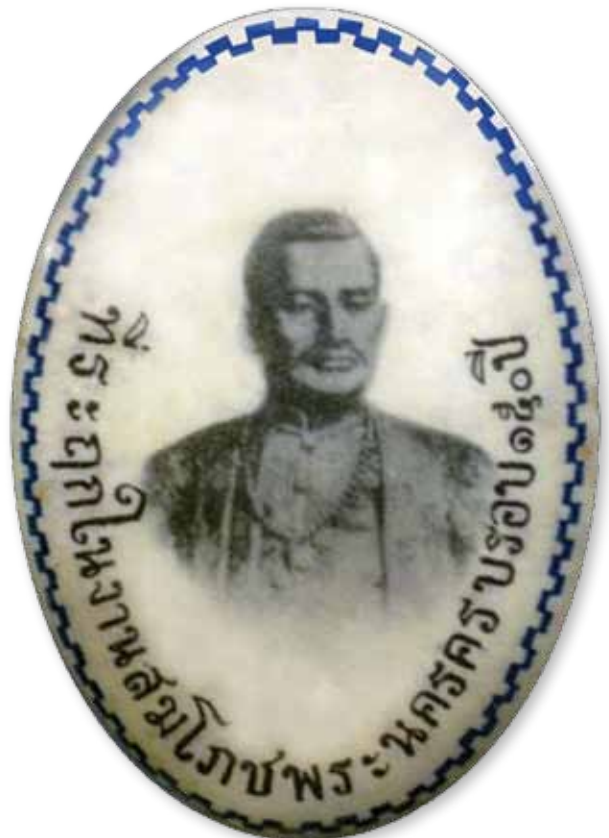
เข็มกลัดหน้าพิลัมพระบรมรูปพระบาทสมเด็จพระพุทธยอดฟ้าจุฬาโลกมหาราช ที่นายมาลี สยามวาลา ขอพระบรมราชานุญาตผลิตและจำหน่ายเพื่อหารายได้สมทบในการจัดงานสมโภชพระนครครบรอบ 150 ปี กิ่งหนึ่ง และมอบให้โรงเรียนสวนกุหลาบกึ่งหนึ่ง

21 เมษายนของทุกปี อาจจะตรงกับวันคล้ายวันเกิดของใครสักคน หรืออาจเป็นคนที่คุณรัก เพื่อนสนิทมิตรสหาย คนในครอบครัวของคุณ และสิ่งที่ขาดไม่ได้คือ เด็กๆ รอยยิ้ม หรือร่วมกันเป่าเทียนฉลองวันคล้ายวันเกิดด้วยกัน