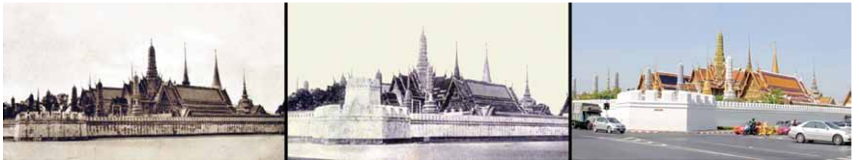
วัดพระศรีรัตนศาสดารามในพระบรมมหาราชวัง กับมุมมองผ่านเลนส์ในห้วงเวลาแผ่นดินกรุงรัตนโกสินทร์ 231 ปี

ถือเป็นสะพานแห่งแรกของสยามที่สามารถเปิดกลางสะพานเพื่อยกให้เรือแล่นผ่านได้พร้อมกันนี้ก็ได้มีการจัดงานเฉลิมพระนครเพื่อเป็นการฉลองครั้งยิ่งใหญ่ยาวนานถึง 7 วัน 7 คืน ที่บริเวณเชิงสะพานพระพุทธรูปอดฟ้า เรียกได้ว่าเป็นช่วงที่ใบหน้าของชาวสยามเต็มเปี่ยมไปด้วยรอยยิ้มและความสุขสนุกสนานเมื่อได้มองหรือเดินข้ามสะพานแห่งนี้